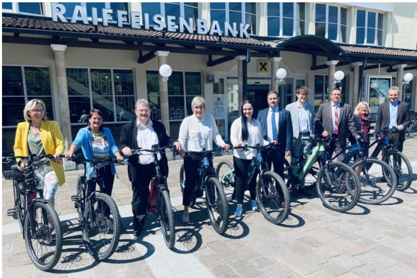
Mit dem Jobrad düsen die Mitarbeiter der Raiffeisenbank Gunskirchen mit geförderten E-Bikes jeden Tag in die Arbeit.